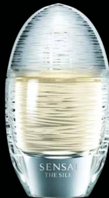
SENSAI THE SILK EAU DE TOILETTE 50mL

Een elegante, rijke geur. De aromatische noten, zoals zinnelijke amber, omhullen de huid.