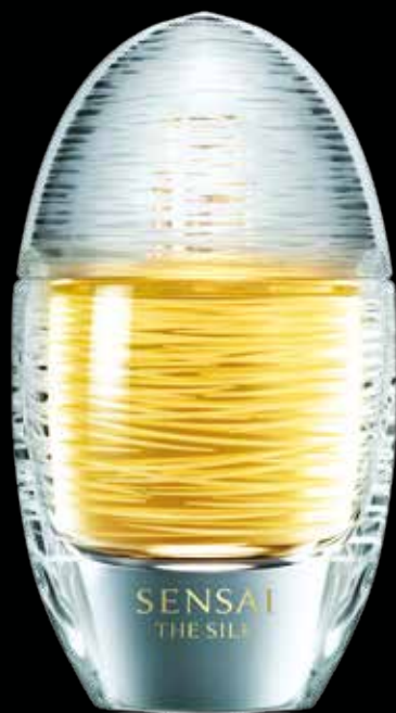
SENSAI THE SILK EAU DE PARFUM 50mL

Een zachte, vrouwelijke geur, die elke vrouw de elegantie van pure zijde geeft. In samenspel met de huid ontstaat een geur die haar unieke karakter onderstreept.